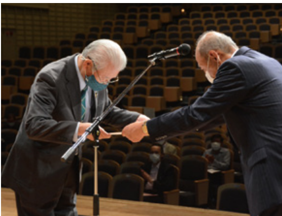
伊賀FCくノ一三重サテライト