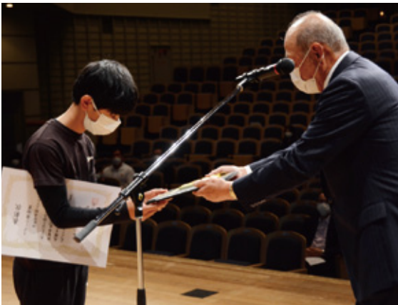
ゆめが丘陸上クラブ

今年も、三重とこわか国体・とこわか大会が開催されます。受賞されました皆さんの益々のご活躍を期待します。