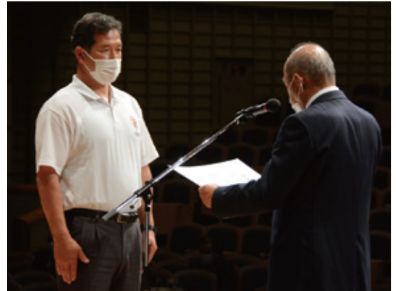
神村学園高等部伊賀