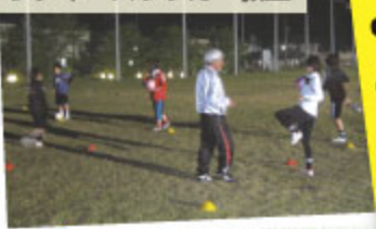
★レディースサッカー教室