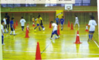
★ジュニアサッカー教室