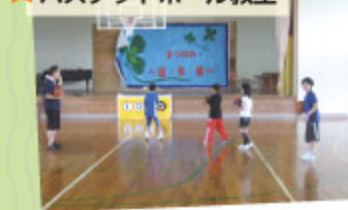
★バスケットボール教室