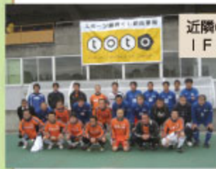
▲シニアサッカー交流戦の様子▶