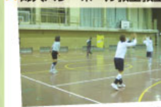
★婦人バレーボール教室