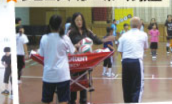
★ジュニアバレーボール教室