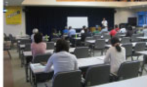
▲コンディショニングと熱中症予防